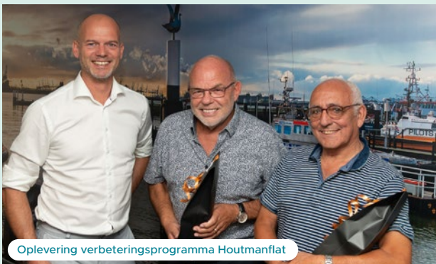
Oplevering verbeteringsprogramma Houtmanflat

We investeren in de kwaliteit van onze woningen met grote en kleine onderhoudsprojecten. Zoals in 2019 de aanpak Scheepsbuurt en het verbeteringsprogramma Houtmanflat; de eerstgenoemde net begonnen, de andere na veel hindernissen afgerond. In april selecteerden we Smits Vastgoedzorg als bouwpartner voor de aanpak van de Scheepsbuurt. Samen ontwikkelen we een plan om onderhoud uit te voeren en de 105 eengezinswoningen energiezuiniger en daarmee comfortabeler te maken. We hebben een bewonersprojectcommissie opgericht met geïnteresseerde bewoners. Deze denkt namens alle bewoners mee en adviseert over het plan, de uitvoering en de bewonerscommunicatie. Ook bij het verbeterings-