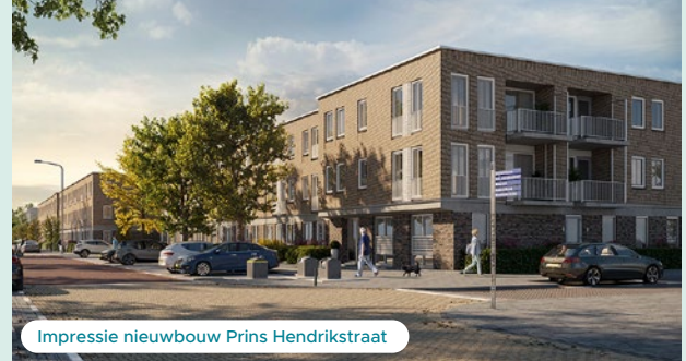
Impressie nieuwbouw Prins Hendrikstraat