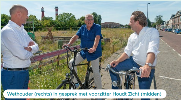
Wethouder (rechts) in gesprek met voorzitter Houdt Zicht (midden)