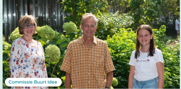
Commissie Buurt Idee