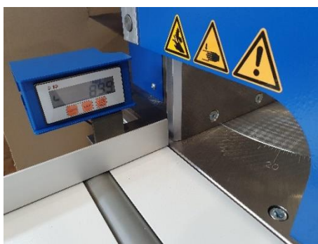
Digitale weergave zaaghoek