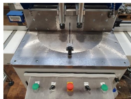
Handmatige aanpassing van tussenliggende hoeken