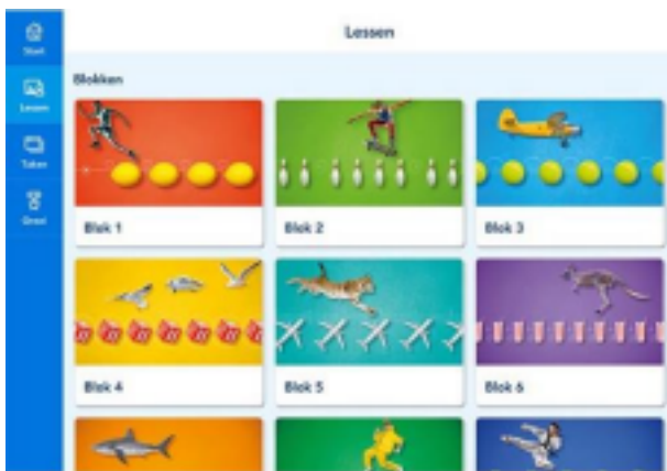
Startpagina rekenen op het chromebook

Voor vragen zijn we altijd bereikbaar. Samen maken we er een leuk jaar van!