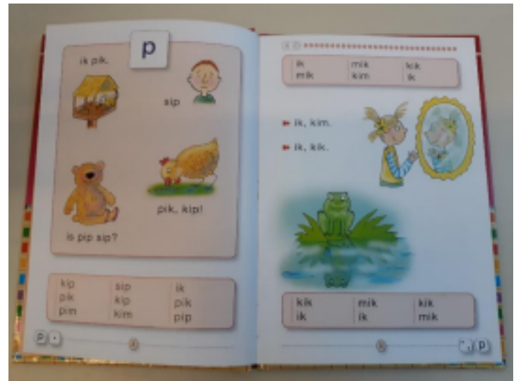
Veilig en vlot kern 1